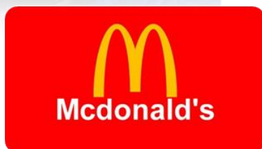
Lekker op eten